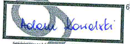
(własnoręcznie podpis wnioskodawcy (nie wykraczać poza ramkę))