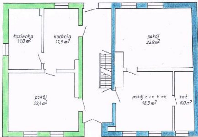
LOKAL MIESZKALNY NR 1 PARTER